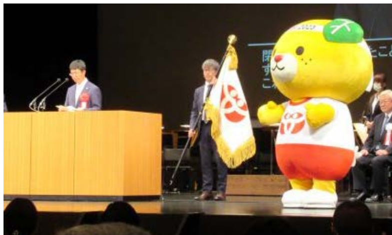
笑顔のえひめ大会マスコットキャラクター『みきゃん』