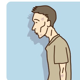
極端に痩せている、顔色が悪い、生気がない、不自然なアザが見られる。