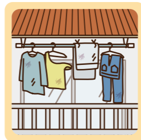
同じ洗濯物が干されたままの状態が続いている。