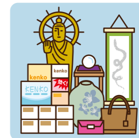
法外な高額商品や大量の健康食品などが置いてある。