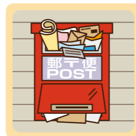
郵便物や新聞がポストに溜まっている。