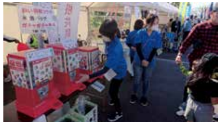
福祉ふれあい祭りでのガチャガチャ募金 (門川町)