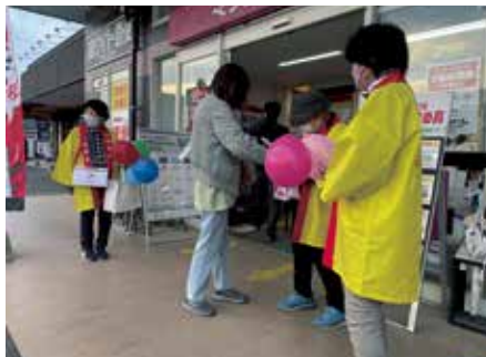
ボランティアの方々による街頭募金 (高鍋町)