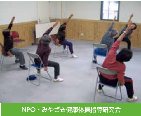
NPO・みやざき健康体操指導研究会