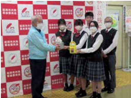
聖心ウルスラ学園高等学校による募金の贈呈式 (延岡市)