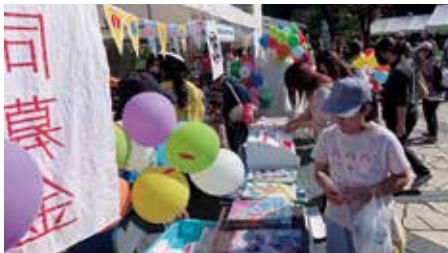
みやざき健康ふくしまつり (宮崎市)