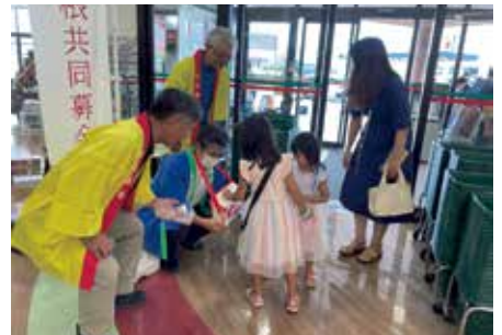
地域ボランティアによる街頭募金 (日向市)