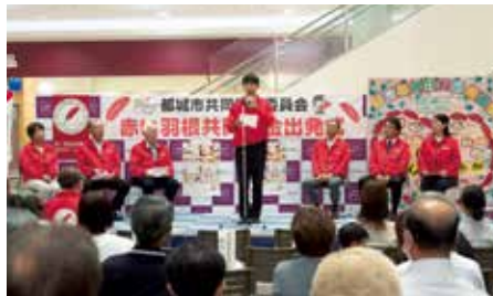
赤い羽根出発式 (都城市)