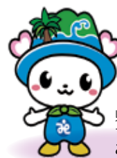
県社会福祉協議会 マスコットキャラクター みぶくちゃん

貸付対象者や返還免除要件は貸付により異なりますので、詳しくは県社会福祉協議会のホームページを確認いただくか、福祉人材貸付相談室へ直接お問い合わせください。