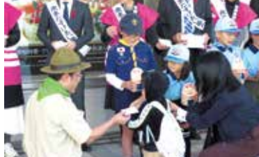
地域歳末たすけあい街頭募金の様子 (宮崎市共同募金委員会)