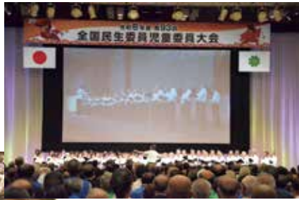
民生委員の歌「花咲く郷土」斉唱

民生委員・児童委員制度・活動のより一層の充実・強化をめざし、全国の民生委員・児童委員の代表者や民生委員児童委員協議会関係者2,739名(県外1,967名・県内772名)が参加しました。