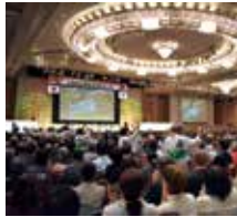
民生音頭「愛の小鳩」

宮崎大会は平成5年以來31年ぶりの開催であり、県内全市町村の代表者による実行委員会を準備を進めてきました。県内民生委員・児童委員と関係者で参加者を精一杯歓迎しました。