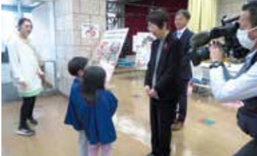
NHK 歳末たすけあい募金受付の様子 (NHK 宮崎放送局)