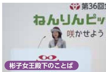
彬子女王殿下のことば