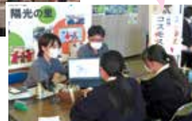
福祉用具 展示コーナー (宮崎会場)