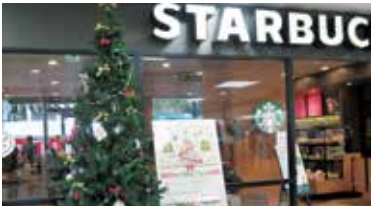
クリスマスリボンツリー募金を 市内5ヶ所で実施