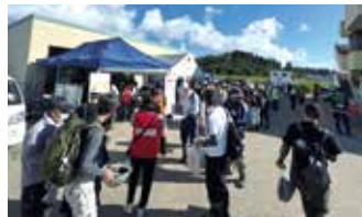
●緊急小口資金特例貸付等業務