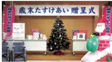
歳末たすけあい贈呈式の様子 (宮崎県福祉総合センター)

共同募金運動の一環として、12月1日から「歳末たすけあい運動」を実施しました。 この運動は、新たな年を迎える時期に、課題を抱える生活困窮者や高齢者、障がい者、子どもたちなど、福祉サービスを必要とする人に、誰もが地域社会の一員として孤立することなく自分らしく、安心して暮らすことができるように支援するための運動です。 歳末たすけあい運動にお寄せいただいた募金は、県内で支援を必要としている人たちに有効に活用させていただきます。 県民の皆様の心温まるお気持ちをお寄せいただきましたことに、心より感謝申し上げますと共に、本運動に御協力いただいた関係機関・団体の方々に對し、お礼を申し上げます。