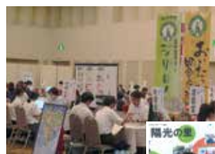
法人・事業所の ブース

開催にあたっては、ハローワークや市町村及び市町村社協の皆様にご協力いただき、ありがとうございました。