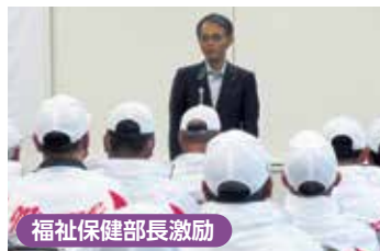
福祉保健部長激励