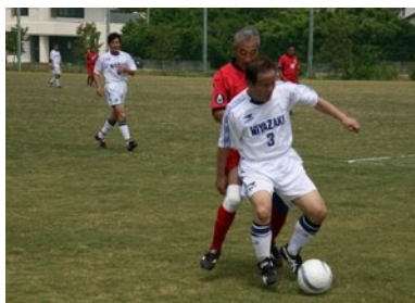
宮崎ねんりんピックの開催