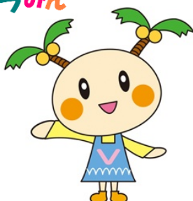
宮崎県社協ホームページ