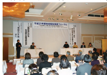
福祉課題を考えるフォーラム