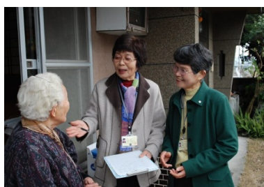
民生委員さんによる訪問活動