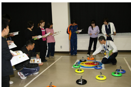
ニュースポーツの指導者研修