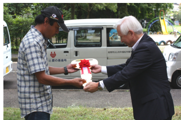
車両(基金号)の贈呈