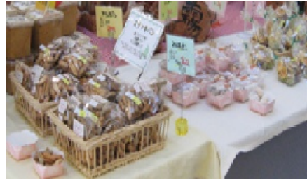
イオンモール宮崎での授産施設製品販売