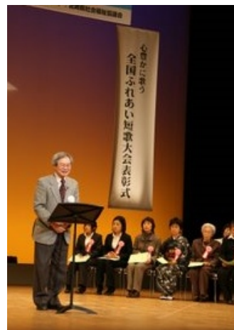
全国から多くの応募がある短歌大会