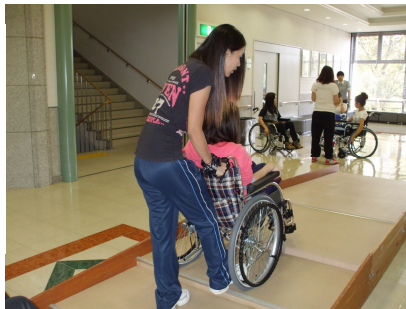
介護体験の入門コース