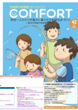
宮崎県社協機関紙「Comfort」