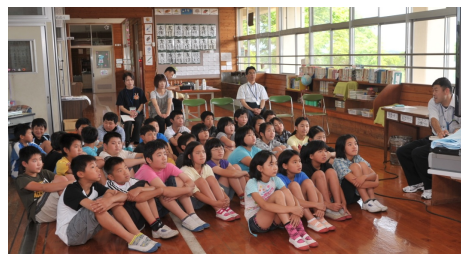
小学校での福祉教育講演会