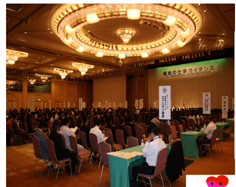
福祉の仕事ガイダンス